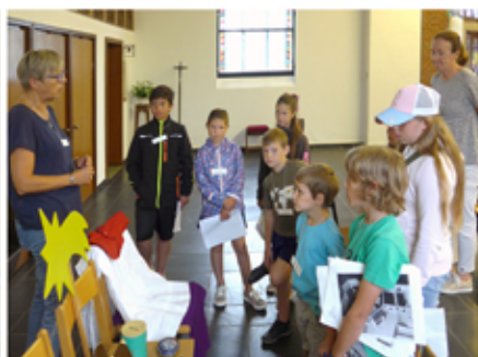
Das ist die Zeit des Kirchenjahrs