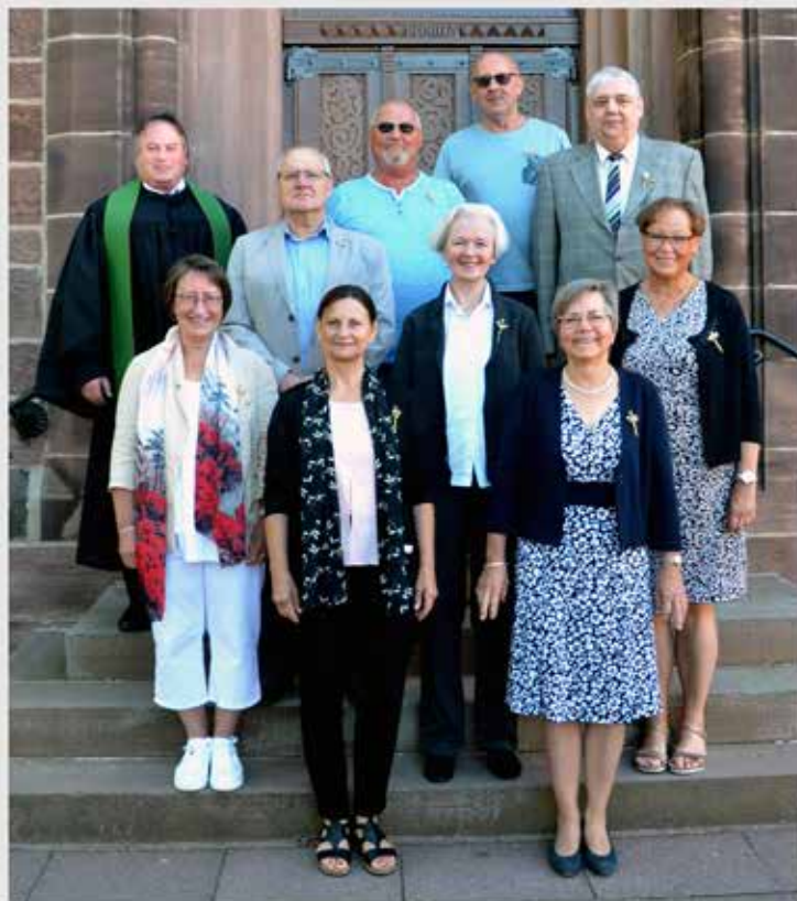
die Gold Konfirmanden,