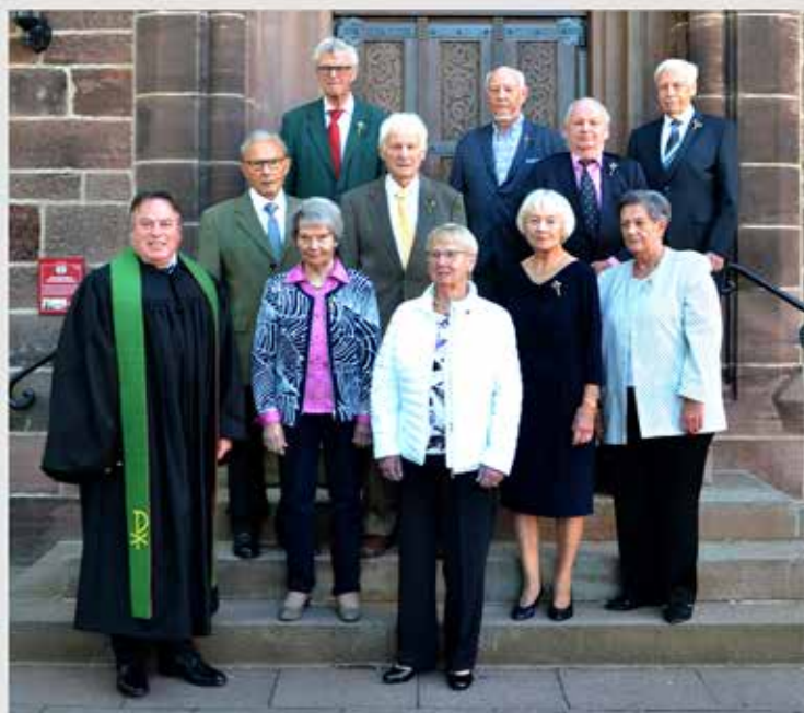
sowie die Eisern und Gnaden Konfir- manden