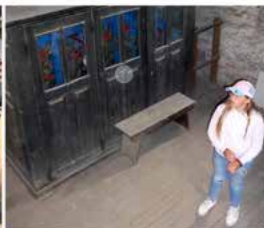
der Aufstieg zum Glockenturm ist geschafft und die Glocken und das Uhrwerk werden bestaunt

Am Ende der Kirchenrallye wurden im Altarraum für jedes Kind eine kleine Kerze entzündet und gemeinsam ein Segensgebet gesprochen und ein Lied gesungen.