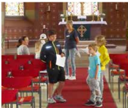
wie groß ist denn die St. Dionys Kirche?

Anschließend machte sich die Gruppe auf den Weg zur ev. luth. St. Dionys Kirche. Hier ging die Kirchenrallye weiter. Zu entdecken gab es auch hier so einiges, wie das Taufbecken, die Empore mit der riesigen Orgel und vieles mehr. High - light des Tages war die Besteigung des Kirchturms mit seinen Glocken.